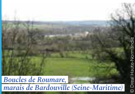
Boucles de Roumare, marais de Bardouville (Seine-Maritime)

Cette protection a pour objectif de conserver les caractéristiques du site, l'esprit des lieux, et de les préserver de toute atteinte grave.