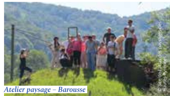
Atelier paysage – Barousse

Le ministère de la Transition écologique et solidaire (MTES) organise chaque année un appel à projets à destination des collectivités et leurs intercommunalités. Les quinze lauréats sélectionnés bénéficient d'une assistance technique et financière à la réalisation de leur plan de paysage. Indépendamment de l'appel à projets, les collectivités peuvent également partager le retour d'expérience d'un réseau d'une centaine d'autres lauréats regroupés dans le club Plans de paysage à travers le centre de ressources du club qui est public.