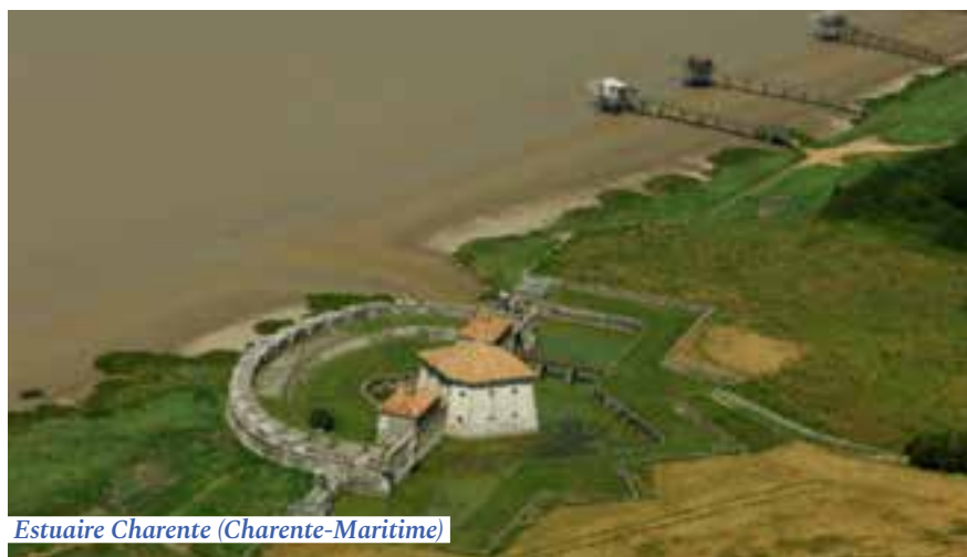
Estuaire Charente (Charente-Maritime)